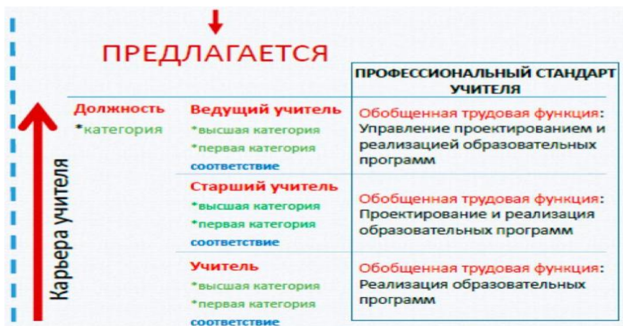
Рисунок 2. Проект профессиональной карьеры педагогического работника

карьеры педагогических работников - «горизонтального» и «вертикального», особенности реализации, которой отражены на рисунке 2.