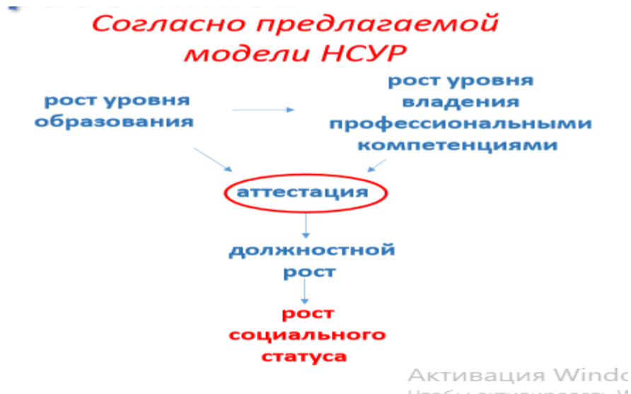
Рисунок 1. Национальная система учительского роста

Проект «Учитель будущего» является ключевым, так как показывает возможности для профессионального и карьерного роста педагога. В проекте предложена модель Национальной системы учительского роста (далее НСУР, рис. 1), которая предлагает новые возможности для профессионального и карьерного роста. Основной целью введения Национальной системы учительского роста является установление уровня профессионализма педагогов, новых возможностей аттестации. Реализация НСУР предполагает следующую структуру: рост уровня образования, рост уровня владения профессиональными компетенциями. Взаимодействие данных компонентов определяет успешность аттестации, способствует должностному продвижению, а соответственно, росту социального статуса педагога.