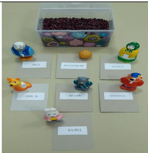
Сенсорная коробка с фигурками-персонажами сказки «Колобок»