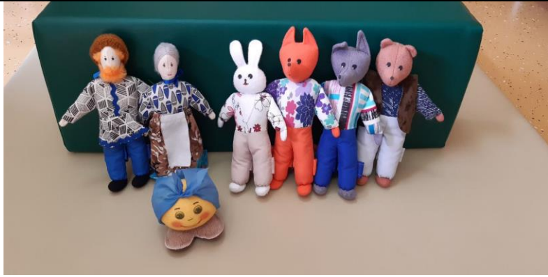
Кукольный театр «Колобок»