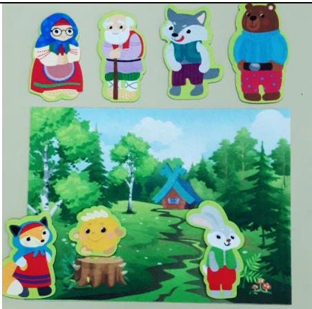
Настольная игра «Колобок» (с магнитной основой)