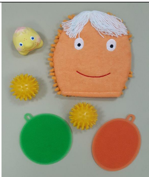
Силиконовые зубки, варежка, резиновый Колобок