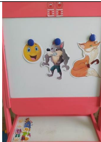
Мольберт с картинками на магнитной основе