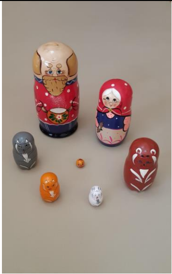
Матрешка «Сказка Колобок»