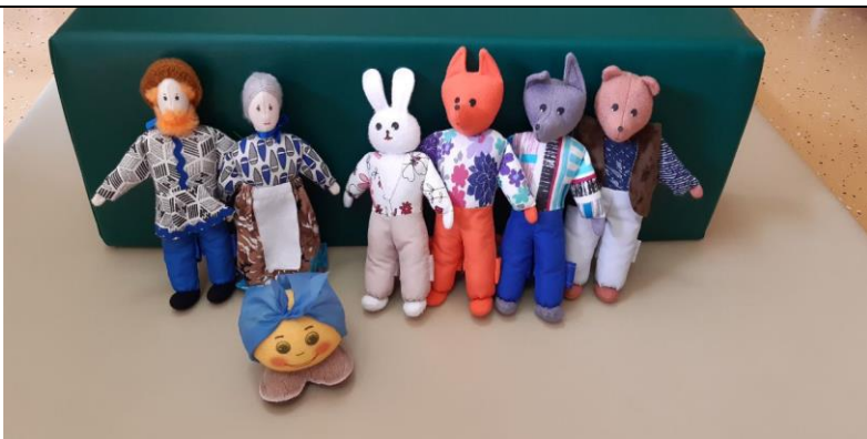
Кукольный театр «Колобок»