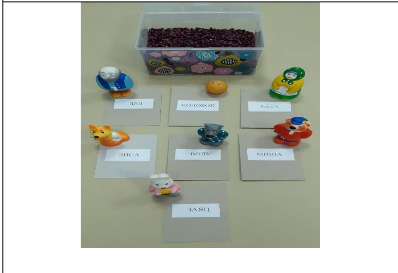
Сенсорная коробка с фигурками-персонажами сказки «Колобок»